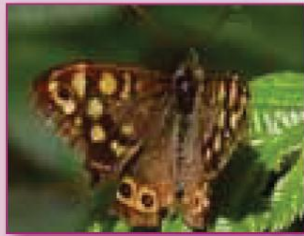
Tircis Pararge aegeria